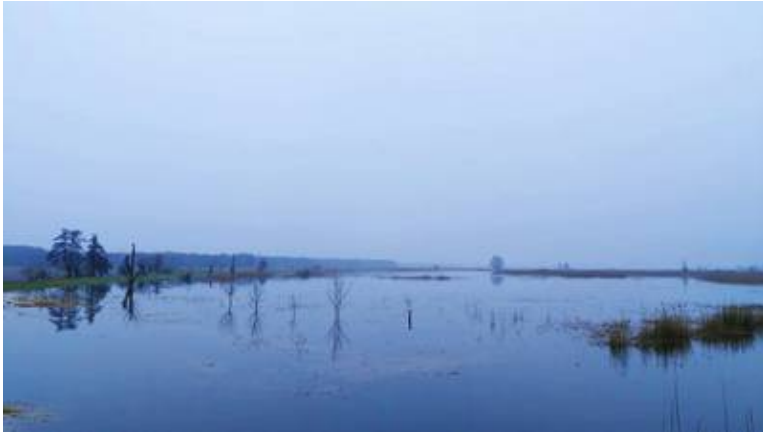
Oderbruch (Schwäne abgereist)

Singschwäne sind Brutvögel der osteuropäischen und sibirischen Taiga. Im Herbst und Winter sind diese Schwäne auch in Mitteleuropa zu beobachten. In Küstengebieten und im norddeutschen Tiefland sind sie regelmäßiger Wintergast. Zunehmend kommt es aber auch zu Übersommerungen und vereinzelt Brut in Mitteleuropa. Der Zug aus den Wintergebieten setzt im Oktober ein. Sie kehren ab März in ihre Brutgebiete zurück (Aufnahme März 2024, Gertrud M.)